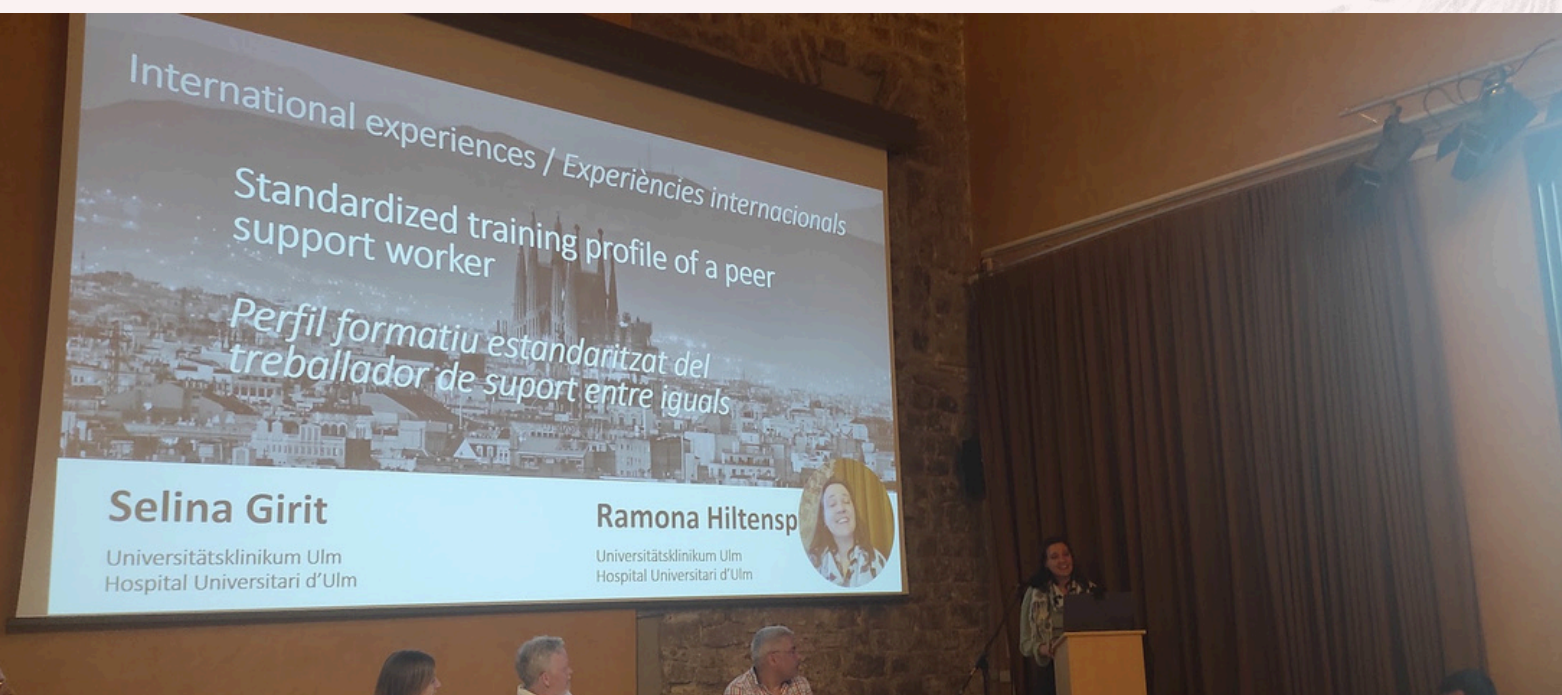
Um perfil de formação padronizado para trabalhadores de apoio entre pares

Facilitar discussões sobre dilemas éticos e incentivar os participantes a desenvolver um código de conduta partilhado para as interações no apoio entre pares.